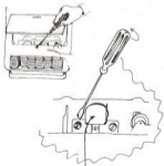
CABEZAL DE LECTURA

AZIMUT. Para regular el azimut (grado de inclinación del cabezal de lectura con la cinta), colocar una cassette en el registrador, pulsar PLAY y regular un pequeño tornillo que hay detrás del cabezal de lectura hasta que se consiga el sonido agudo más fuerte. Es decir, el paralelismo entre la cinta de la cassette y el cabezal de lectura, debe ser lo más exacto posible. De esa forma, se obtendrá la señal fuerte y aguda que indicamos.