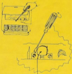
CABEZAL DE LECTURA

AZIMUT. Para regular el azimut (grado de inclinación del cabezal de lectura con la cinta), colocar una cassette en el registrador, pulsar PLAY y regular un pequeño tornillo que hay detrás del cabezal de lectura hasta que se consiga el sonido agudo más fuerte. Es decir, el paralelismo entre la cinta de la cassette y el cabezal de lectura, debe ser lo más exacto posible. De esa forma, se obtendrá la señal fuerte y aguda que indicamos.