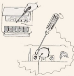
CABEZAL DE LECTURA

AZIMUT. Para regular el azimut (grado de inclinación del cabezal de lectura con la cinta), colocar una cassette en el registrador, pulsar PLAY y regular un pequeño tornillo que hay detrás del cabezal de lectura hasta que se consiga el sonido agudo más fuerte. Es decir, el paralelismo entre la cinta de la cassette y el cabezal de lectura, debe ser lo más exacto posible. De esa forma, se obtendrá la señal fuerte y aguda que indicamos.